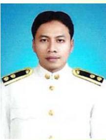
บุคลากร สคช.๘